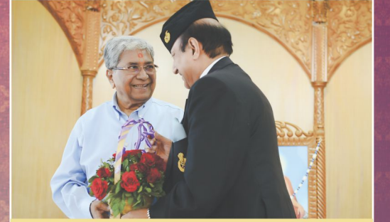
જનરલ અરવિંદ મહાજનનાં વંદન