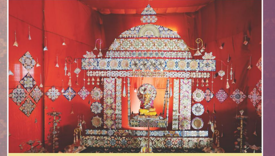
ચલણી નોટોથી સુશોભિત સંપદ હિંદોરનાં દિવ્ય દર્શન