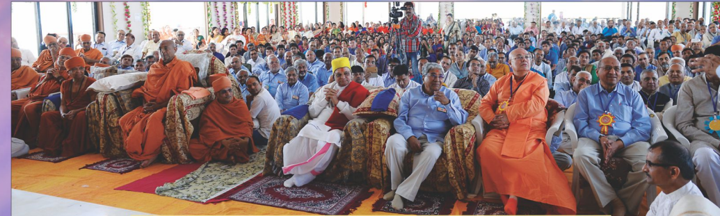
મંદિરના મુખ્ય હોલમાં પ્રાણપ્રતિષ્ઠાવિધિનાં દર્શનરત સંતો-અક્ષરમુક્તો