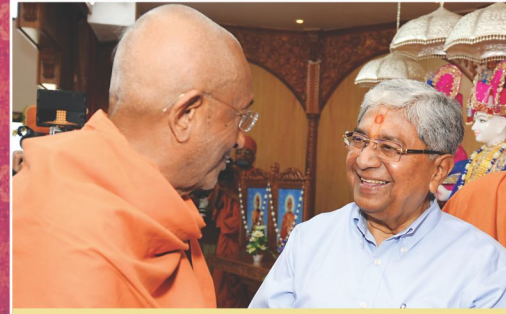
દિવ્ય પ્રભુસ્વરૂપોનાં મંગલ મિલન... દિવ્ય આનંદની અનુપમ ઘડી