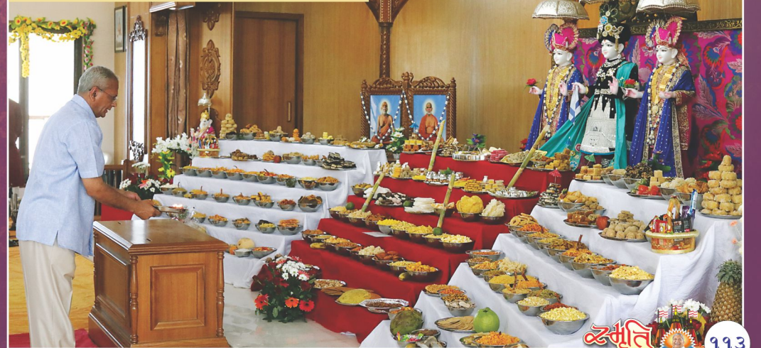
શ્રી ઠાકોરજીમહારાજને પ્રથમ અન્નકૂટ અર્પણ