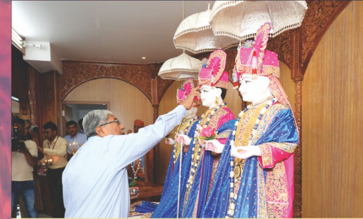
શ્રી ઠાકોરજીને પૂજન-ભાવ અર્પણ