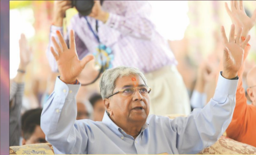
શ્રી મુક્ત-અક્ષર-પુરુષોત્તમમહારાજને ઘણી બમ્મા