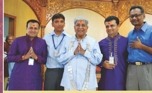
અમદાવાદના ભક્તો દ્વારા ૭૫ ચાંદીના સિક્કાનો હાર અર્પણ