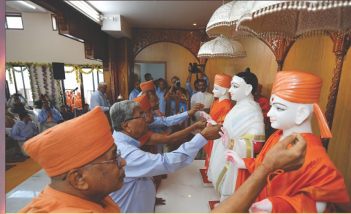
શ્રી મુક્તાક્ષરપુરુષોત્તમમહારાજની મૂર્તિઓની પ્રાણપ્રતિષ્ઠા