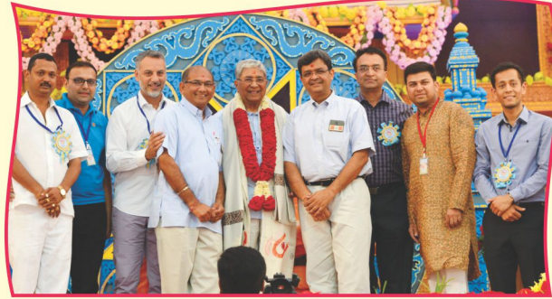
ઑસ્ટ્રેલિયા મંડળના મુક્તો દ્વારા હાર સ્વરૂપી ભક્તિ અર્થ અર્પણ