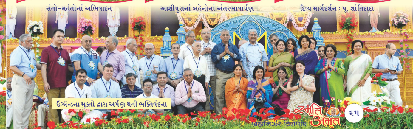
ઈંગ્લેન્ડના મુક્તો દ્વારા અર્પણ થતી ભક્તિવંદના