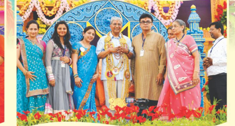
ચૈત્રાઈ મંડળના મુક્તો દ્વારા અર્પણ થતી ભાવગંગા