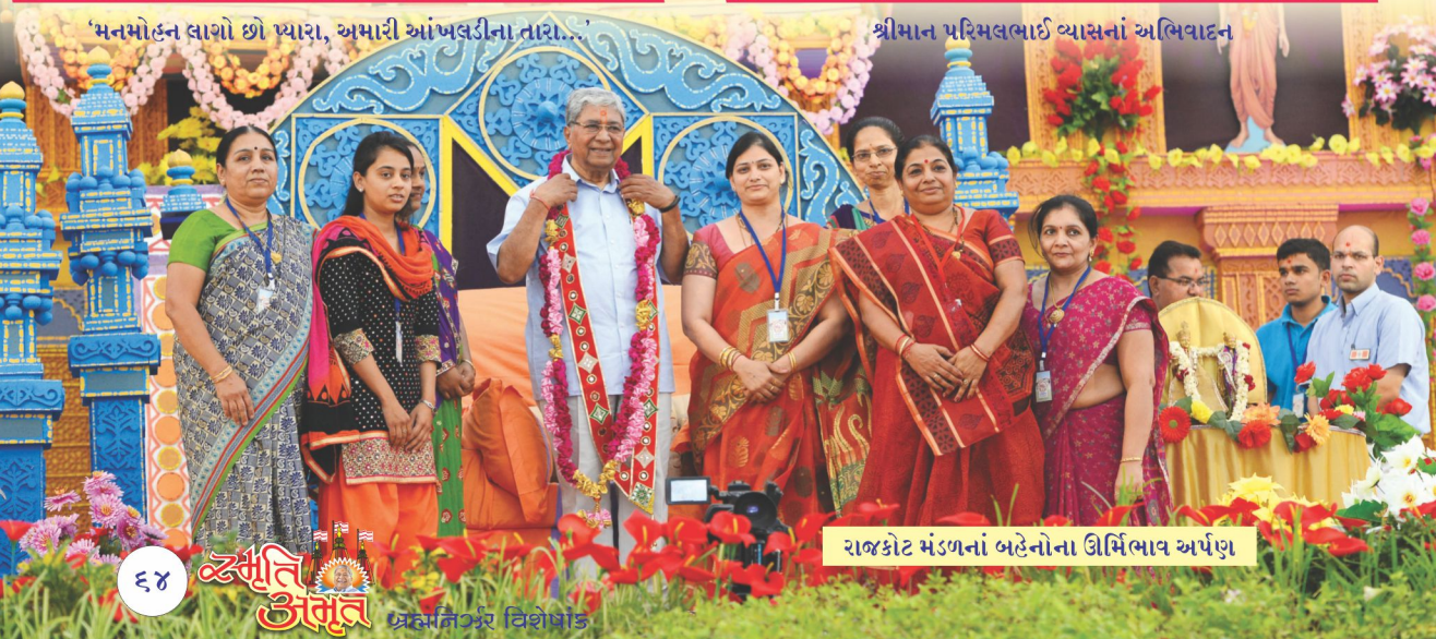
રાજકોટ મંડળનાં બહેનોના ઊર્મિભાવ અર્પણ