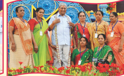
આશીપુરાનાં બહેનોનાં અંતરલાવાર્પણ