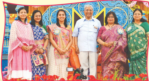
'મનમોહન લાશો છો પ્યારા, અમારી આંખલડીના તારા...'