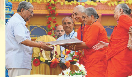
શ્રી ઠાકોરજી માટે ગુણાતીત જ્યોતનાં સંત બહેનો દ્વારા ભેટવંદના