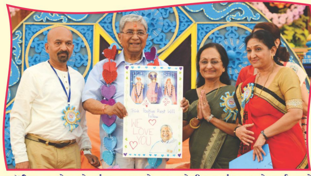
ફ્લોરિડા-યુ.એસ.એ. મંડળના મુક્તો દ્વારા વહેતી હૃદયવંદના અને પ્રાર્થનાઓ