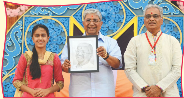
નીકિતા મુશાલેએ તૈયાર કરેલ દિવ્યાકૃતિ અર્પણ