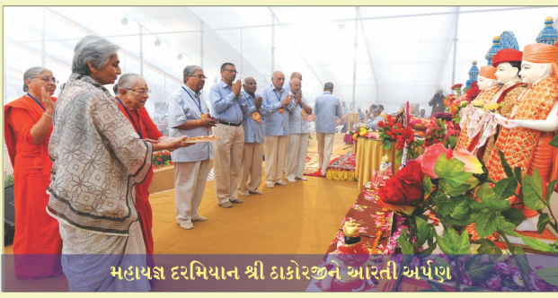
મહાપદ્મ દરમિયાન શ્રી ઠાકોરજીન આરતી અર્પણ