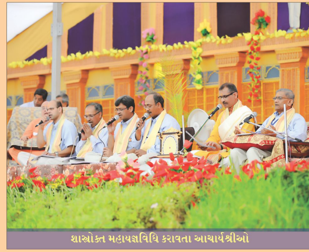
શાસ્ત્રોક્ત મહાયજ્ઞવિધિ કરાવતા આચાર્યશ્રીઓ

યજ્ઞવિધિમાં ઉપયોગમાં લેવાનાર સામગ્રીઓ બાજેઠ પર શોભતી પૂજની મૂર્તિ સમક્ષ સુંદર પેકિંગમાં સજાવીને વ્યવસ્થિત ગોઠવી હતી. યજ્ઞમાનો દ્વારા વિશિષ્ટ વસ્ત્ર પરિધાન કરાયાં હતાં. ઋષિ કુમારો અને ઋષિ કન્યાઓ દોડી દોડીને સેવા-પરિચર્યા કરી રહ્યાં હતાં. આ સમગ્ર દિવ્ય વાતાવરણ સૌનું મન મોહી રહ્યું હતું. આખોય 'અમૃત મહોલ'-સભામંડપ ભક્ત મેદનીથી ચિક્કાર ભર્યો હતો. હજારો મુક્તો-મુમુક્ષુજનો આ દિવ્ય યજ્ઞનાં દર્શનાર્થે પધાર્યા હતા. અનુપમ મિશનના સંતો-સેવકોની અનુપમ વ્યવસ્થા-સરભરા નિહાળીને સૌના અંતરે અનુપમ છાપ કંડારાઈ ગઈ હતી.