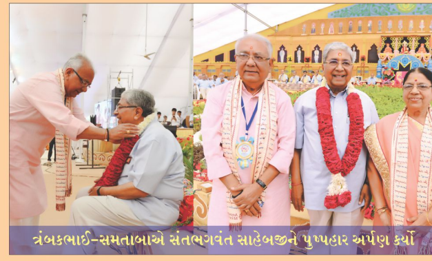
ત્રંબકભાઈ-સમતાબાએ સંતભગવંત સાહેબજીને પુષ્પહાર અર્પણ કર્યા

આ મહાયજ્ઞમાં યજ્ઞમાનપદે બિરાજિત અને દર્શન કરનાર સૌને દિવ્ય અનુભૂતિનો આનંદ થયો. યજ્ઞમાં શ્રીફળ હોમાયું તેની સાથે આ દિવ્ય સત્સંગમાં જીવન હોમી દેવાના સંકલ્પો અનેકના મનમંદિરમાં જાગ્યા. વેશ, કેશ કે નામ બદલ્યા વગર પણ સાધુતા પ્રાપ્ત થાય, સંસારમાં રહ્યા છતાં પણ અનાસક્ત અવસ્થાને પામી શકાય તેના અનુભવ સૌને અનુપમ મિશનના વ્રતધારી સંતોના જીવનનાં દર્શનથી થયા. અને ગુણાતીત ગુરુમાં જીવને જોડી પરબ્રહ્મને પામવાના સંકલ્પ-મનોરથ આ અનુપમ યજ્ઞમાં સૌએ કર્યા.