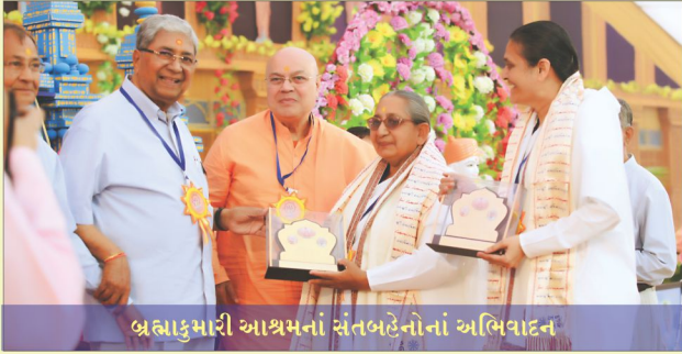
બ્રહ્મકુમારી આશ્રમનાં સંતબહેનોનાં અભિવાદન