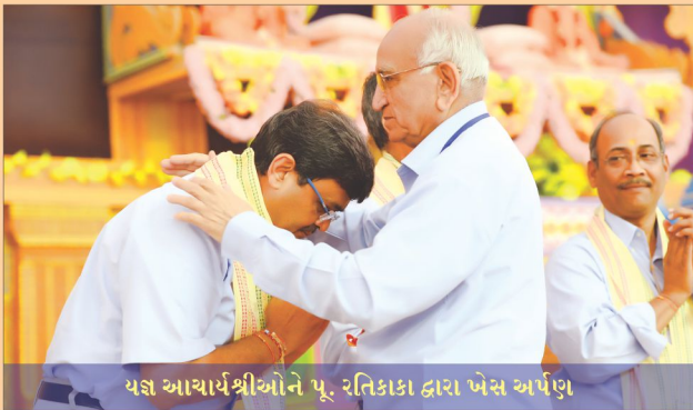
યજ્ઞ આચાર્યશ્રીઓને પૂ. રતિકાકા દ્વારા ખેસ અર્પણ