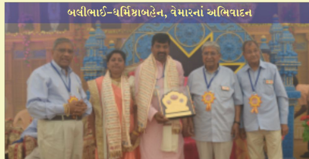
બલીભાઈ-ધર્મિષ્ઠાબહેન, વેમારનાં અભિવાદન