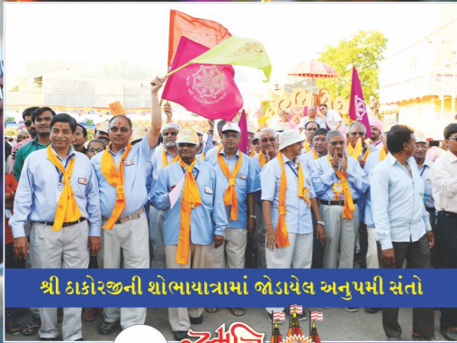
શ્રી ઠાકોરજીની શોભાયાત્રામાં જોડાયેલ અનુપમી સંતો