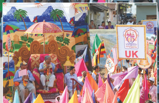
ઓરા આવો મારા લે 'રખડા લહેરી...