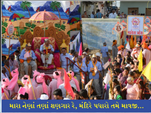
મારા નેણાં તણાં શણગાર રે, મંદિરે પધારો તમે માવજી...