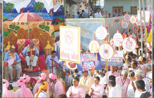
ભક્તોની અભિવંદના ઝીલતા સંતભગવંત સાહેબજી