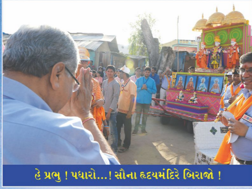
હે પ્રભુ ! પધારો...! સૌના હૃદયમંદિરે બિરાજો !