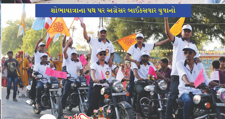
શોભાયાત્રાના પથ પર અગ્રેસર બાઈક્સવાર યુવાનો