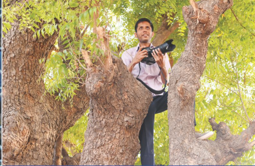
ધન્ય ઘડીઓને કેમેરામાં કેદ કરવાની સેવામાં રત વિશ્વતભાઈ