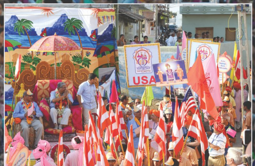
રૂડા લાગો છો રાજેન્દ્ર મંદિરે મારે આવતા રે...