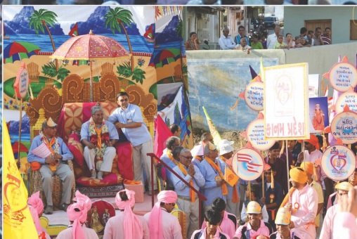
શોભાયાત્રામાં બ્રહ્મસૂત્રો, મંગલ ચિહ્નો ધારિત પ્રદેશવાર મુક્તો