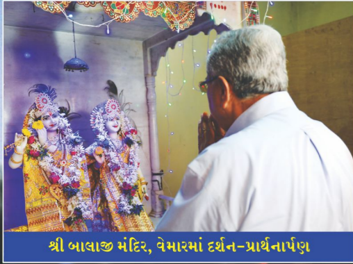
શ્રી બાલાજી મંદિર, વેમારમાં દર્શન-પ્રાર્થનાર્પણ