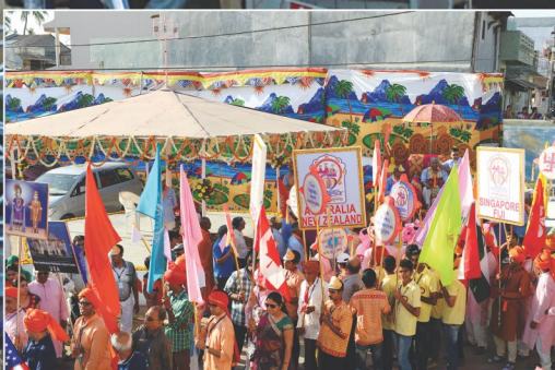
શ્રી ઠાકોરજીને આવકારતા આનંદઘેવા અક્ષરમુક્તો