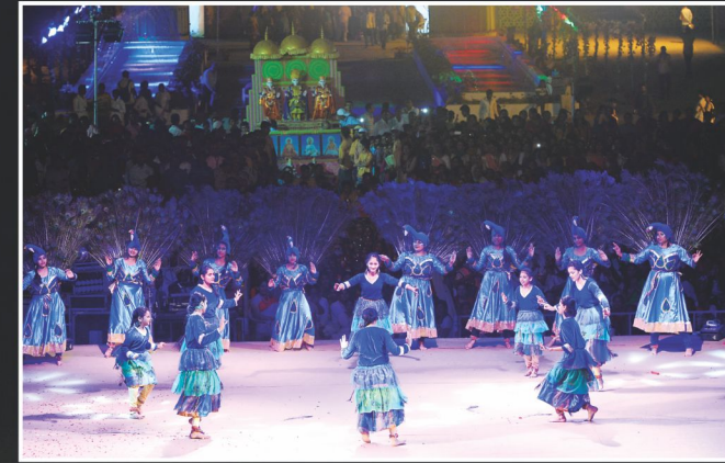
વર્ષા નૃત્ય : અમદાવાદ પ્રદેશની યુવતીઓ