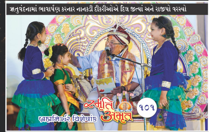
ઋતુવંદનામાં ભાવાર્પણ કરનાર નાનકડી દીકરીઓએ દિવ જીત્યાં અને રાજીપો વરસ્યો