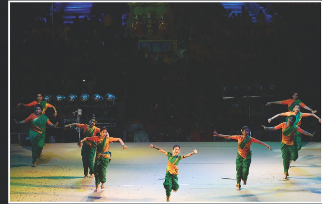
હેમંત નૃત્ય : મુંબઈ પ્રદેશની યુવતીઓ