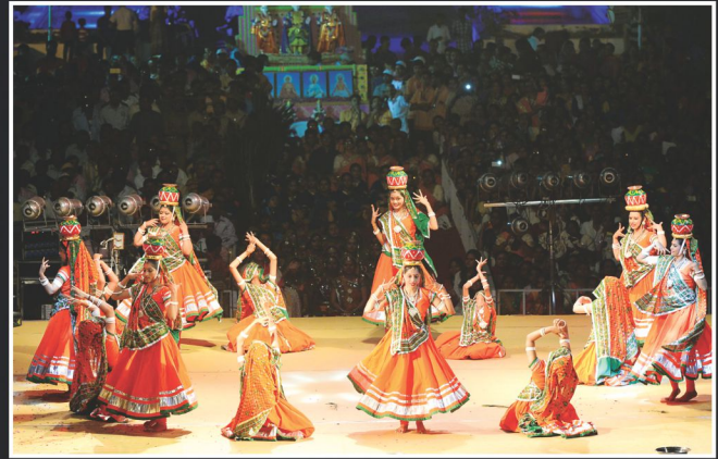
શિશિર નૃત્ય : ચરોતર પ્રદેશની યુવતીઓ