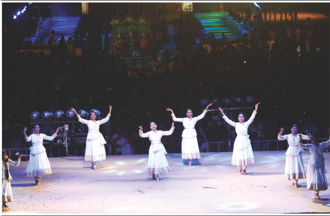
શરદ નૃત્ય : અંકલેશ્વર મંડળની યુવતીઓ