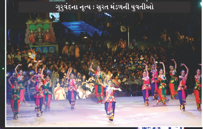
ગુરુવંદના નૃત્ય : સુરત મંડળની યુવતીઓ