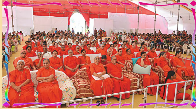
મૂર્તિપ્રતિષ્ઠા મહોત્સવ મહાસભામાં સદ્ગુરુ સંત બહેનો, અશ્વરમુક્તો