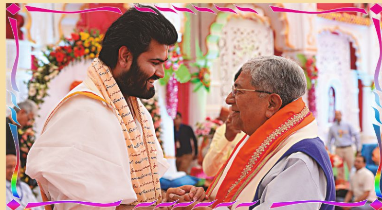
દિવ્ય સંતોનાં દિવ્ય મિલનનાં દિવ્ય દર્શન