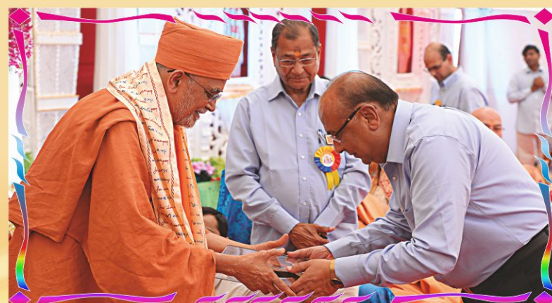
સદ્ગુરુ સંત પૂ. પ્રેમસ્વરૂપસ્વામીજીને મહોત્સવ સ્મૃતિઅર્પણ